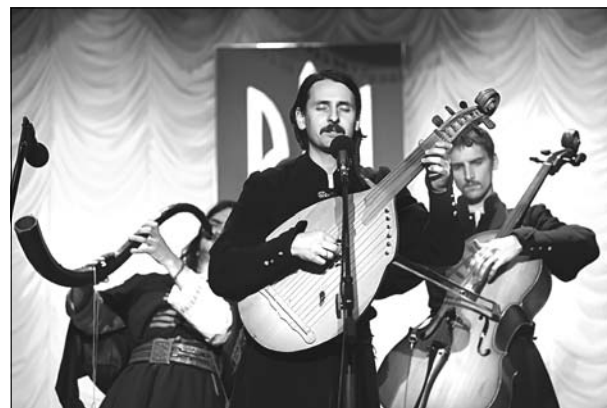
У концертній програмі взяв участь гурт «Хорєя козацька»